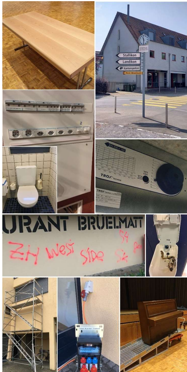
Abbildung 2 - Impressionen aus dem GZB-Alltag