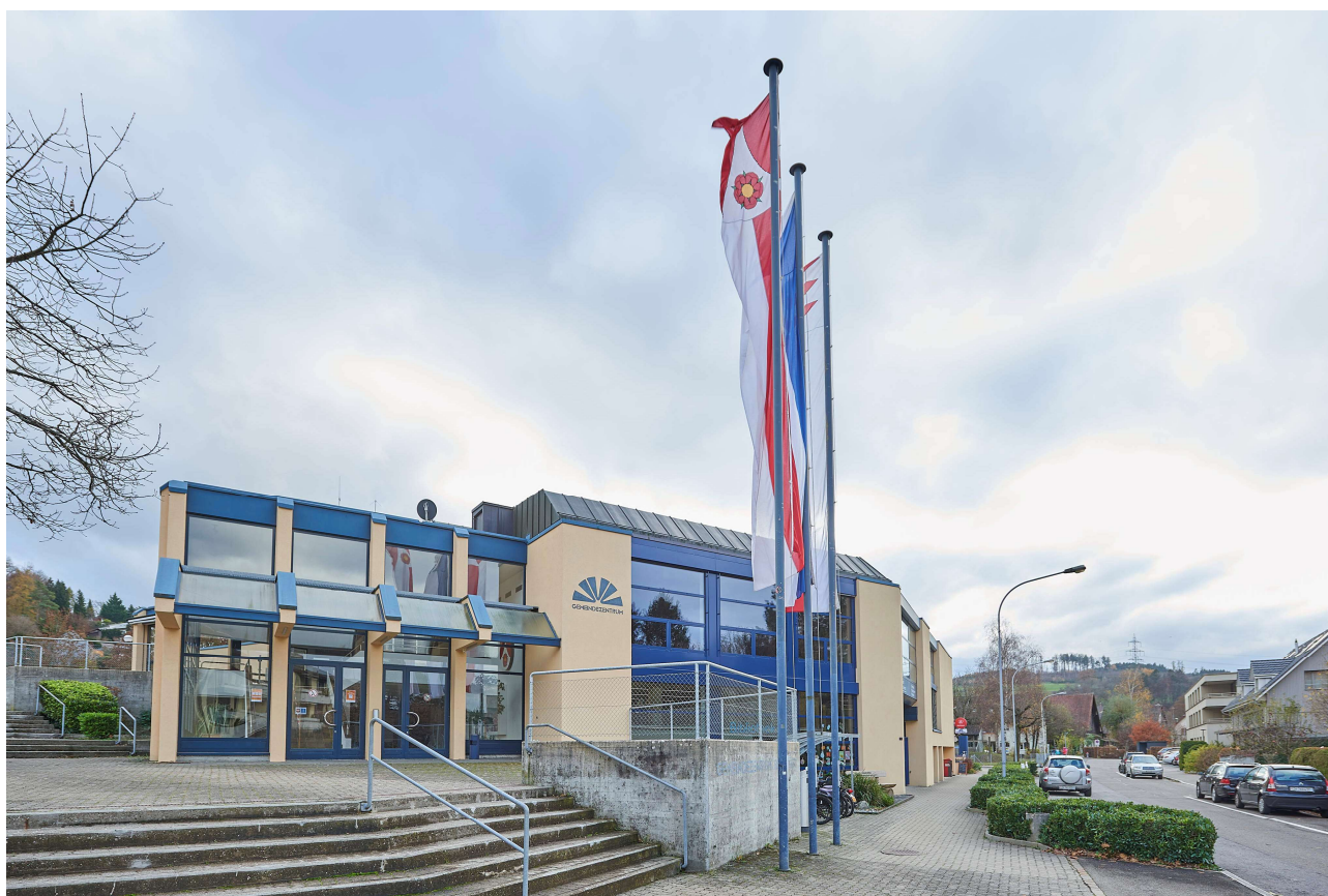
Abbildung 1 - Gemeindezentrum Brüelmatt, Birmensdorf ZH